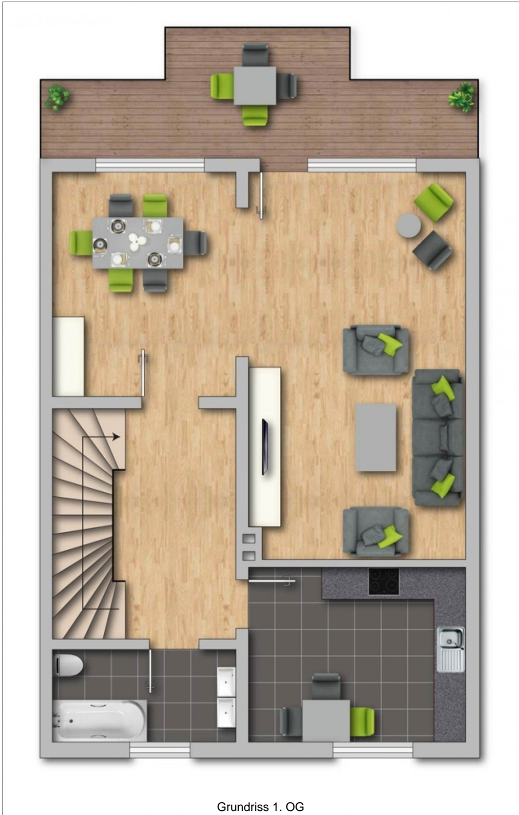
Grundriss 1. OG