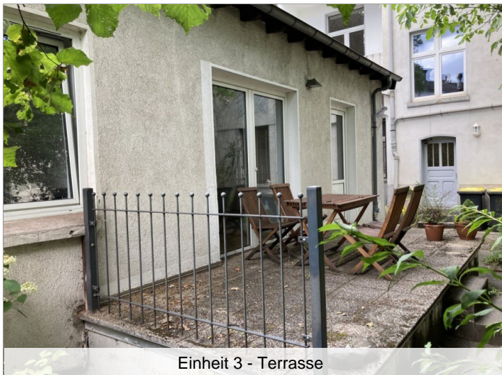
Einheit 3 - Terrasse