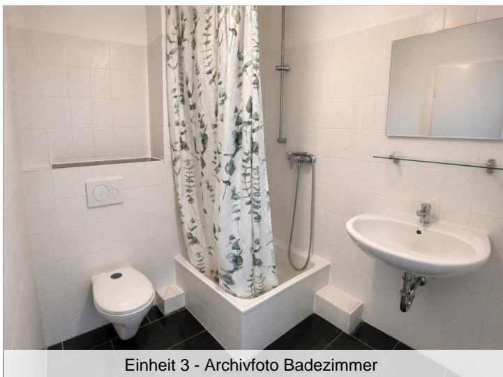
Einheit 3 - Archivfoto Badezimmer