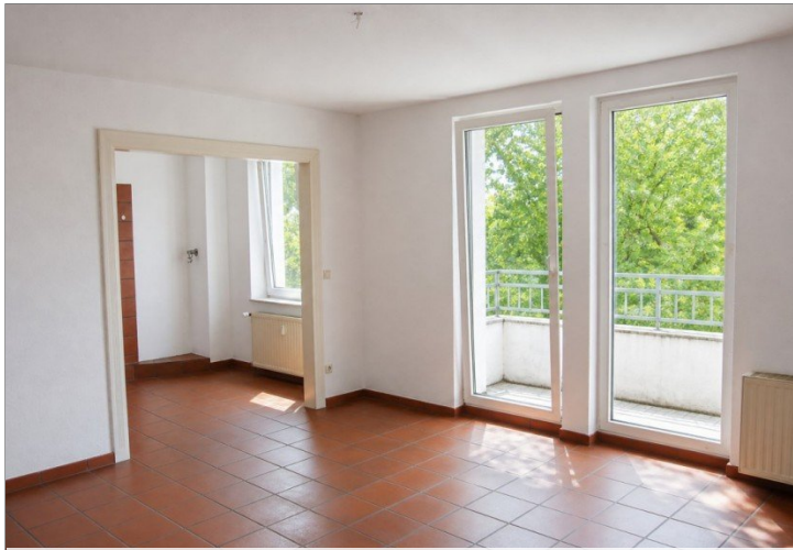
Einheit 6 - Archivfoto Wohnbereich