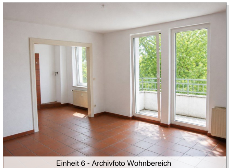
Einheit 6 - Archivfoto Wohnbereich