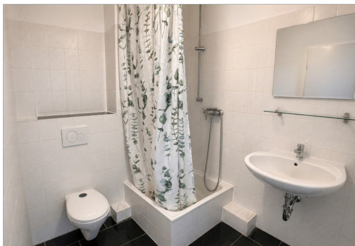
Einheit 3 - Archivfoto Badezimmer