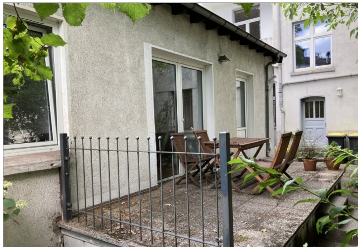
Einheit 3 - Terrasse