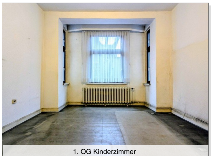
1. OG Kinderzimmer