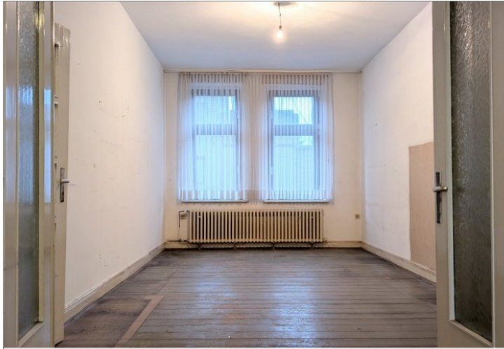
1. OG Wohnzimmer