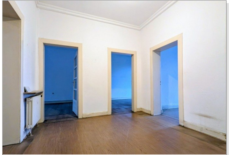
1. OG Flur