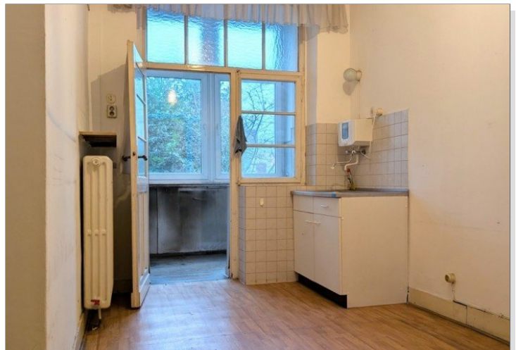
1. OG Küche