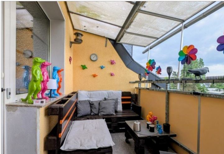
3. OG Balkon