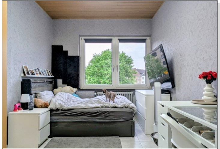
3. OG Kinderzimmer