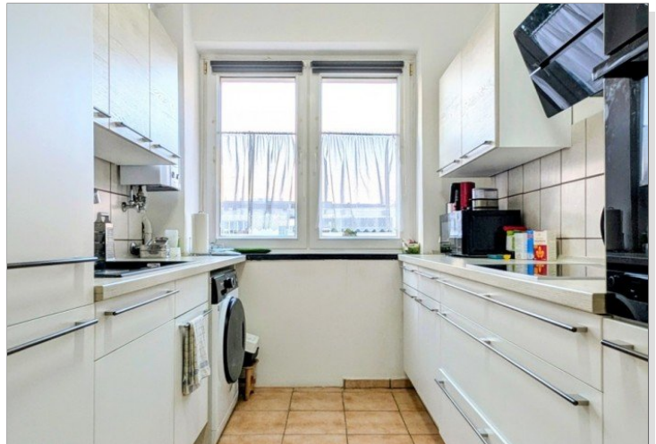
1. OG Küche