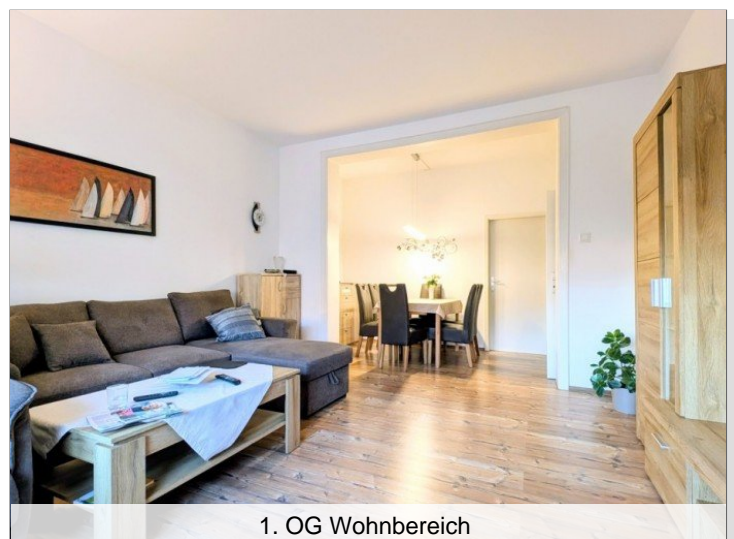
1. OG Wohnbereich