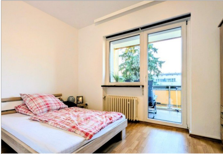
1. OG Schlafzimmer