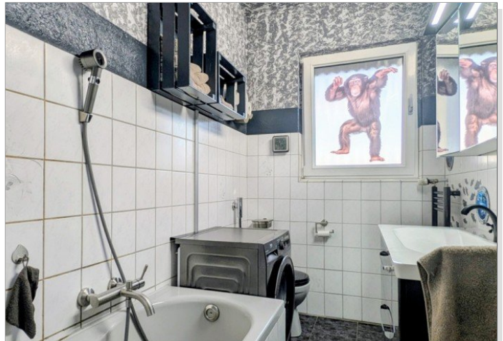
3. OG Badezimmer