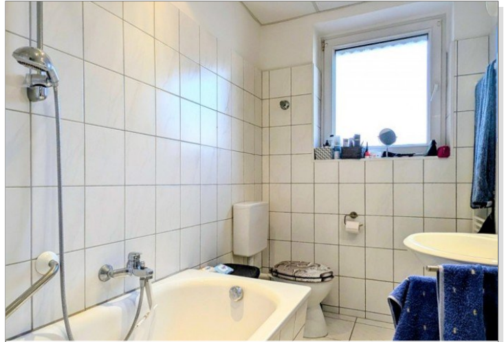
1. OG Badezimmer