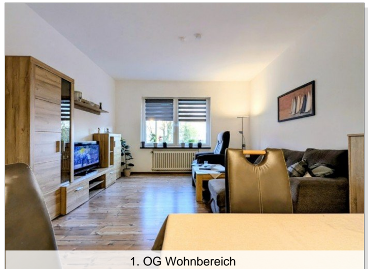
1. OG Wohnbereich