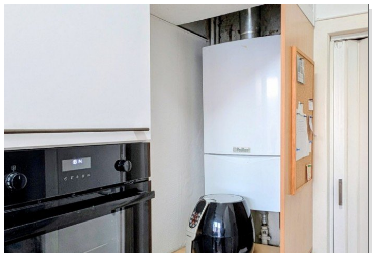
1. OG Gasetagenheizung