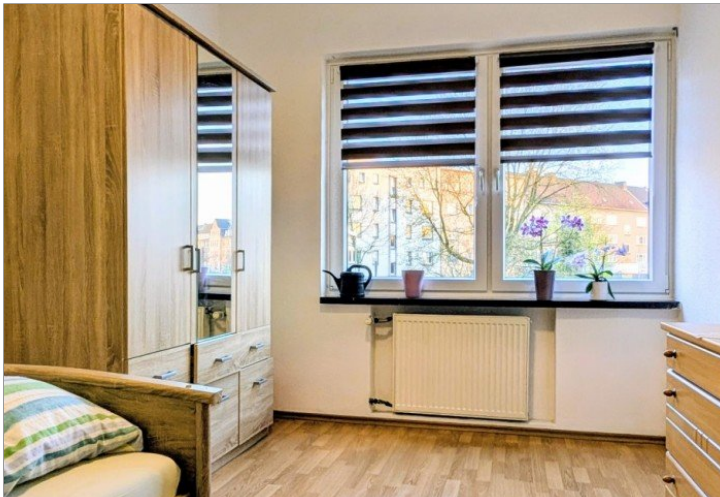
1. OG Kinderzimmer