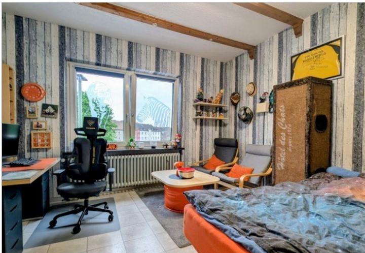
3. OG Kinderzimmer