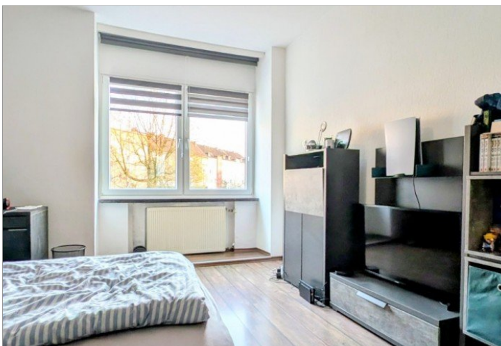
1. OG Kinderzimmer