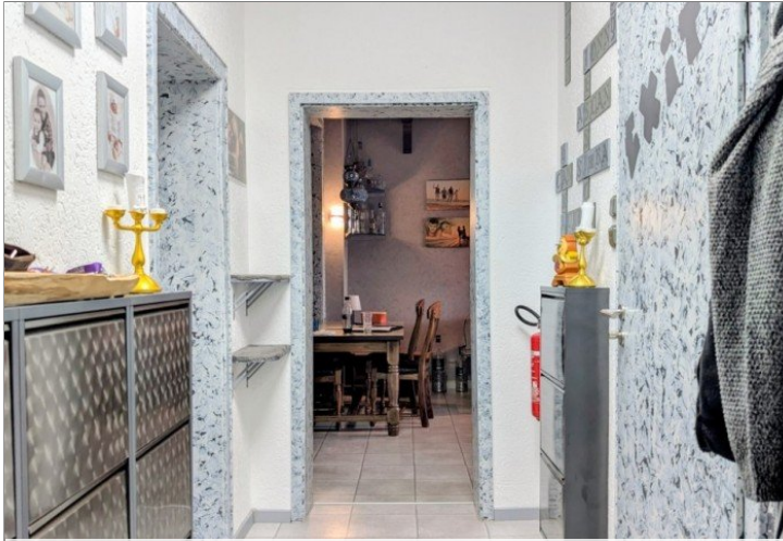
3. OG Flur