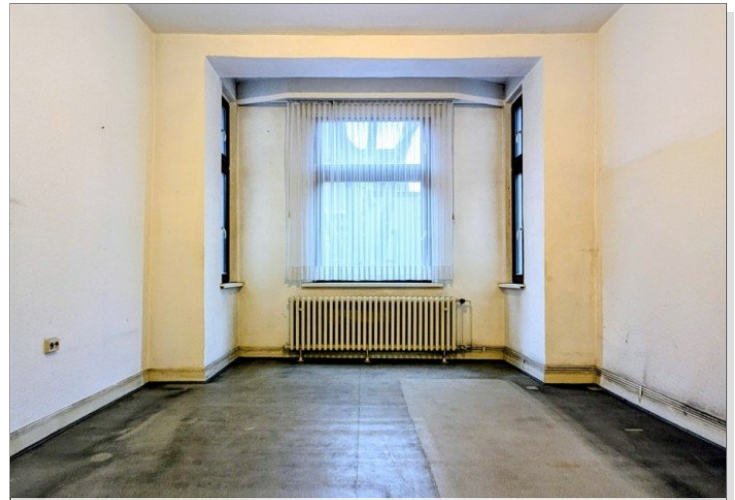
1. OG Kinderzimmer