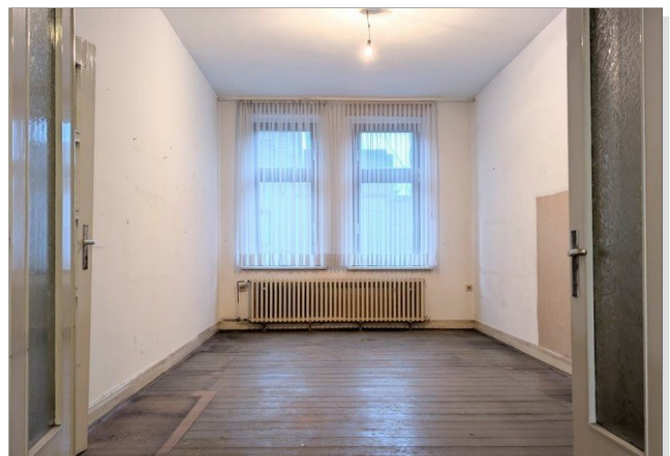
1. OG Wohnzimmer