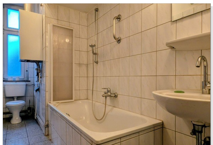
1. OG Badezimmer