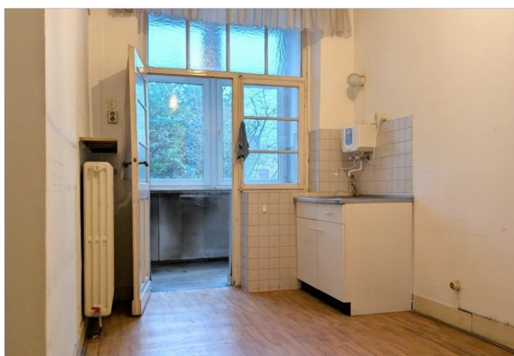
1. OG Küche