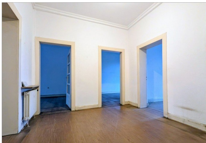
1. OG Flur