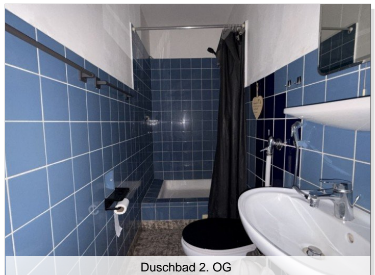
Duschbad 2. OG