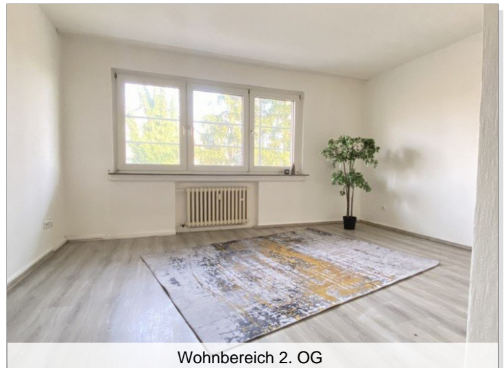
Wohnbereich 2. OG